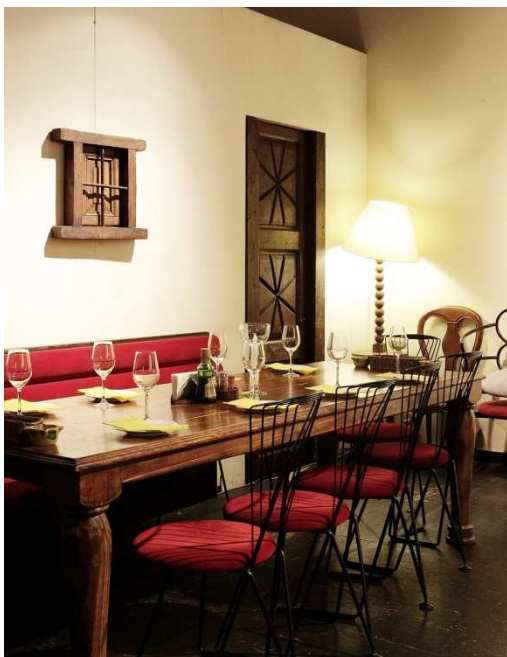
スペインクラブ月島店内の様子

TEL: 03-3525-8380 メール: europa-concier@gaea.ocn.ne.jp